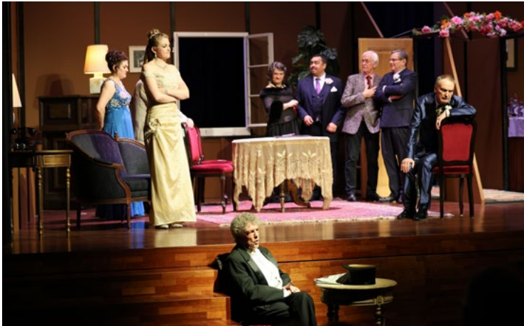
Ensemble in «Un Mari à la Porte»